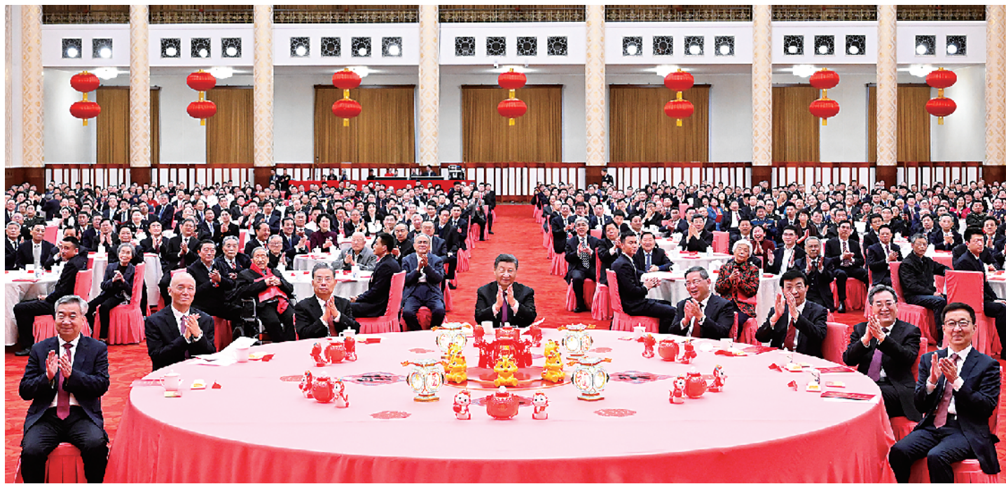
2月8日，中共中央、国务院在北京人民大会堂举行2024年春节团拜会。党和国家领导人习近平、李强、赵乐际、王沪宁、蔡奇、丁薛祥、李希、韩正等同首都各界人士齐聚一堂，共迎新春。

新华社北京2月8日电 中共中央、国务院8日上午在人民大会堂举行2024年春节团拜会。中共中央总书记、国家主席、中央军委主席习近平发表讲话，代表党中央和国务院，向全国各族人民，向香港特别行政区同胞、澳门特别行政区同胞、台湾同胞和海外侨胞拜年。 习近平强调，即将过去的癸卯兔年，是全面贯彻党的二十大精神开局之年。面对异常复杂的国际环境和艰巨繁重的改革发展稳定任务，我们以中国式现代化凝心聚力，统筹推进国内国际两个大局，顽强拼搏、勇毅前行，战胜多重重困难挑战，在全面建设社会主义现代化国家新征程上迈出坚实步伐。 李强主持团拜会，赵乐际、王沪宁、蔡奇、丁薛祥、李希、韩正等出席。 人民大会堂宴会厅灯光璀璨、喜气洋洋，