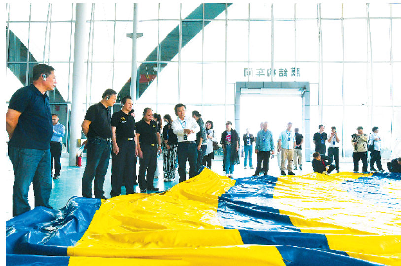
中国杂技产业发展论坛与会嘉宾在周口市杂技艺术研发中心参观。