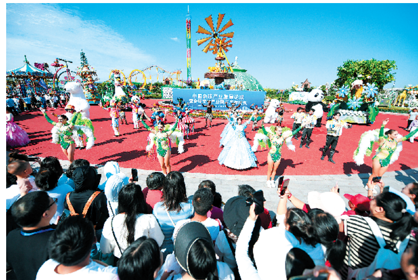
“马戏嘉年华”活动现场狂欢巡游。

中国杂技家协会副主席、中国杂技产业发展委员会主任薛金升对周口杂技产业发展高度评价,他说:“周口具有文化优势、人口优势、交通优势,周口杂技发挥赋予性作用,在文旅和制造上与当地产业发展紧密相连,对经济建设具有深刻的积极意义。未来,周口杂技要在产业布局上更精细、产业思维上更高远,做到立足周口、辐射河南、走向全国,甚至走向世界!”②18