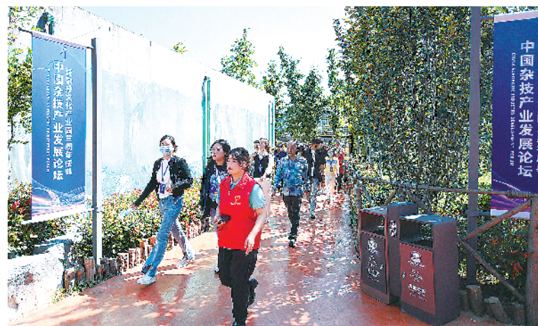
国家级、省级、市级媒体参观国际杂技文化(周口)产业园。