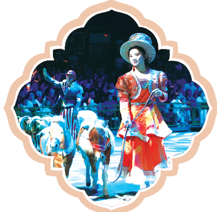
马戏表演中的动物与观众见面。