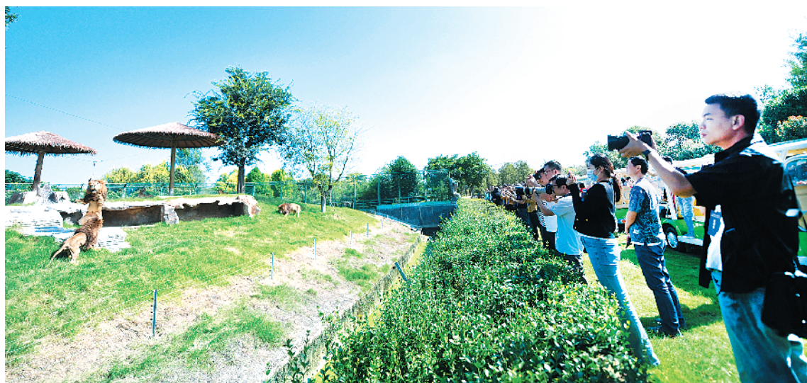
记者聚焦国际杂技文化(周口)产业园野生动物世界项目。