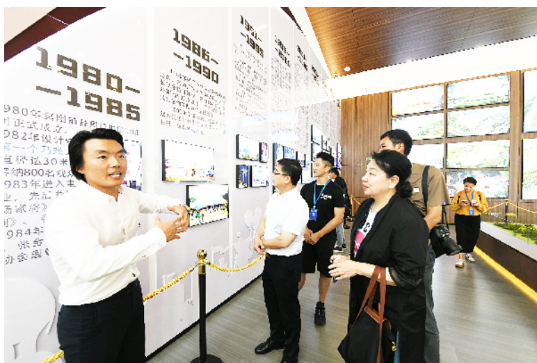
专家了解杂技产业发展。