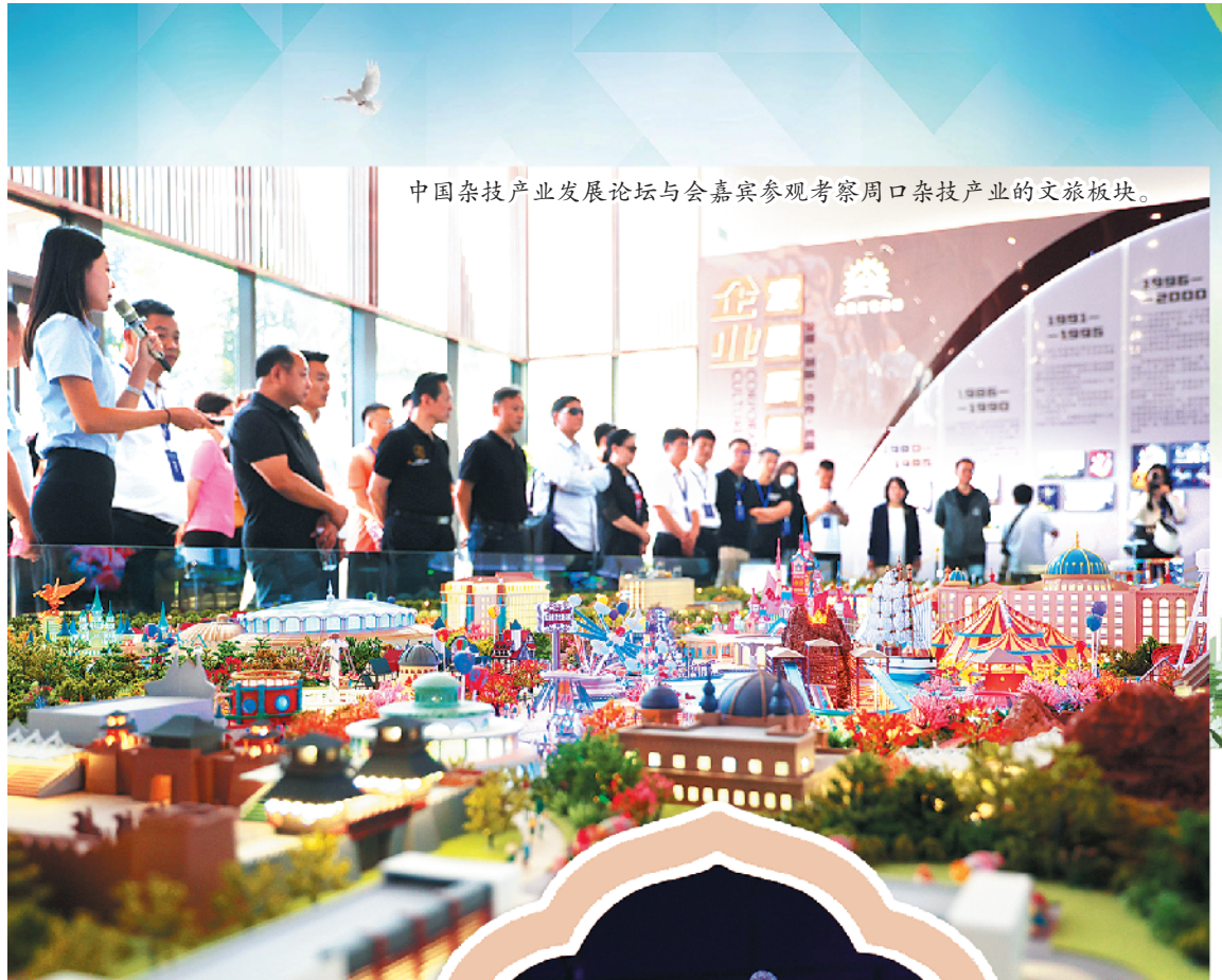
中国杂技产业发展论坛与会嘉宾参观考察周口杂技产业的文旅板块。